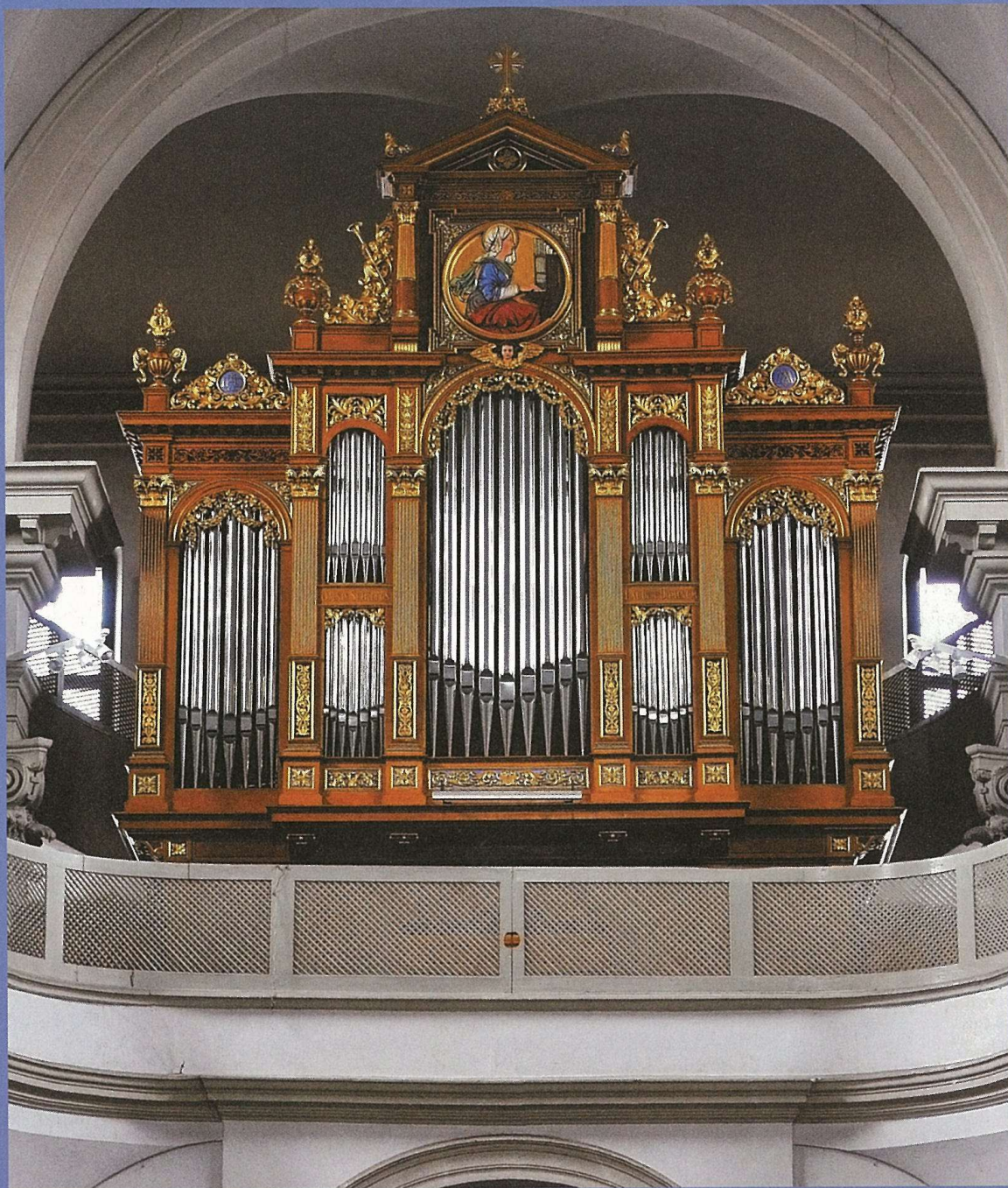
GORŠIČEVE ORGLE V ŽUPNIJSKI CERKVI SV. TROJICE V LJUBLJANI Brane Košir in Restavratorski center Ljubljana (2014)