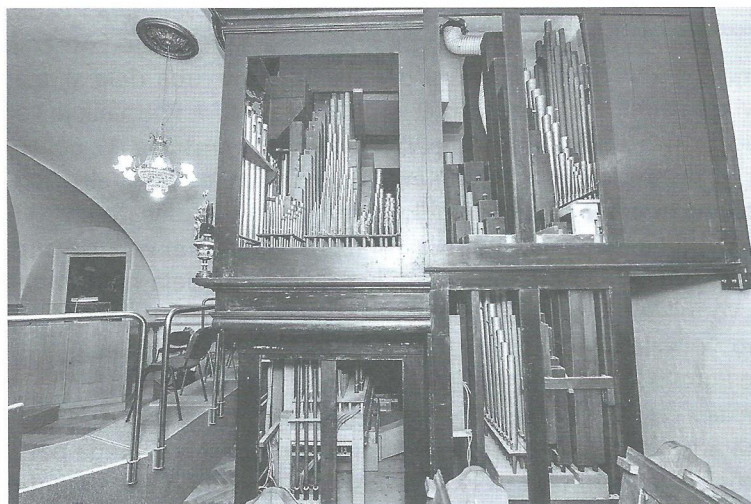
Stranski pogled v notranjost orgel.