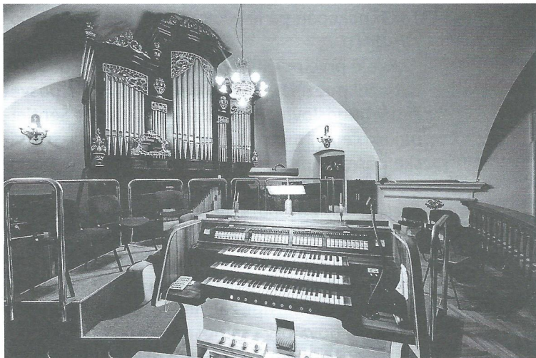
Mayer-Jenkove orgle na koru župnijske cerkve v Šentvidu pri Stični.

današnje Slovenije. Pregledane in kolavdirane so bile 10. septembra 1912. Skladatelj Ignacij Hladnik (1865–1932) jih je v Cerkvenem glasbeniku (1912, št. 10, str. 82–83) umestil med najboljše orgle na Kranjskem.