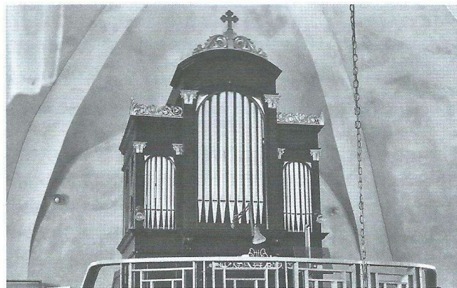
Orgle Karola Kriegla (1904, op. 5) iz Olševka.

ventilator), 609 piščali (les: 221; kovina: 388), manualno in pedalno sapnico, sapni tlak je bil 86 mm VS, uglasitev je bila a^1 = 443,7 Hz pri 25,7 °C, vlaga pa 53-odstotna. Manualni register Dunajska Flavta 8' in pedalni register Octavbass 8' sta bila, sodeč po ohranjenosti in znakih obdelave, novejše izdelave. Registrska kancela pedalnega registra Octavbass 8' je bila dodana k ostalemu pedalu, odpiral ga je manubrij Gedeckt 8'. Zanimiva je bila razlika med pedalno in igralno trakturo: manualna je dvigovala stožce preko kotnikov, igralna traktura pedalne sapnice pa je dvigovala stožce preko osi. V prihodnosti bo v staro orgelsko omaro montiran nov inštrument.