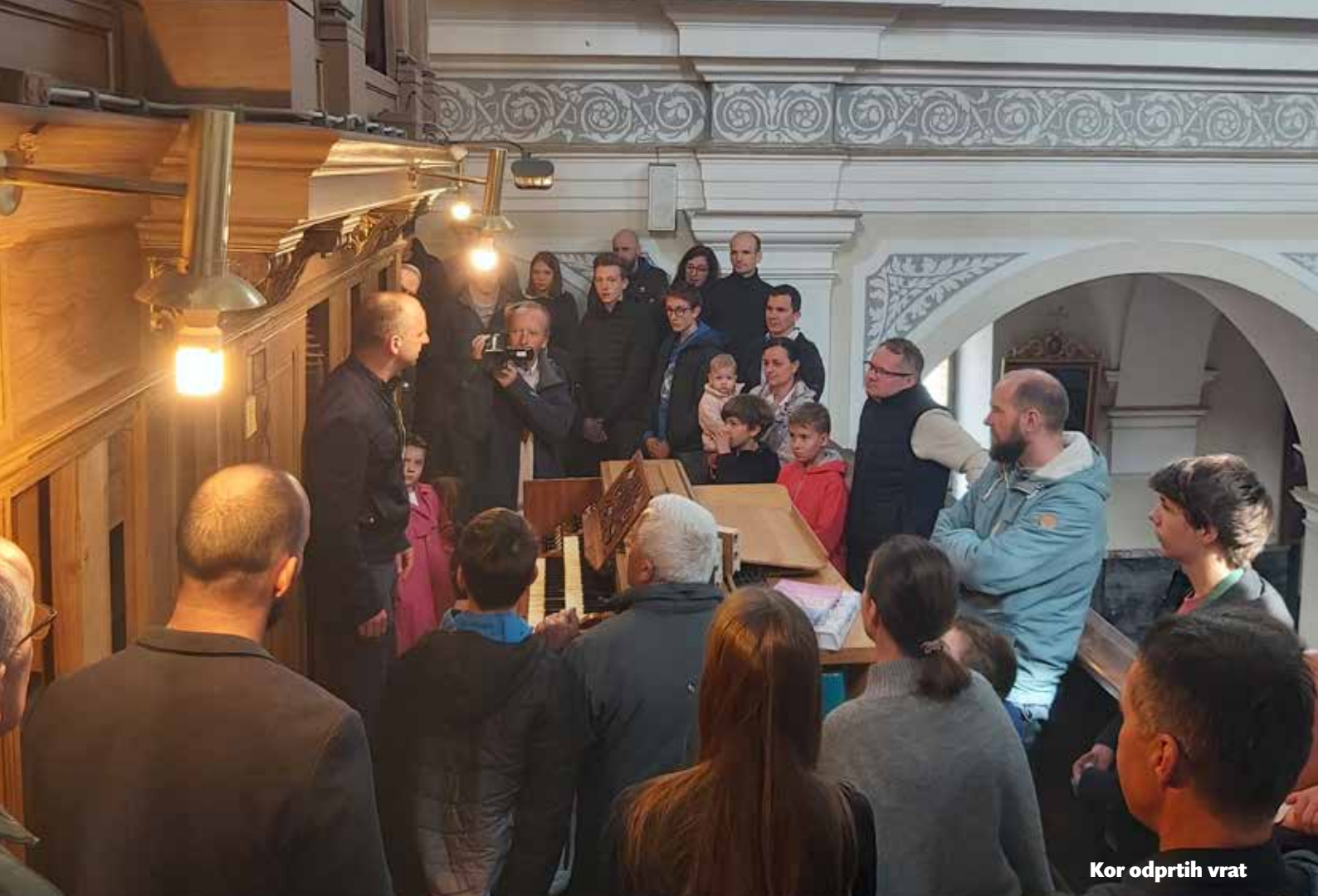
Kor odprtih vrat