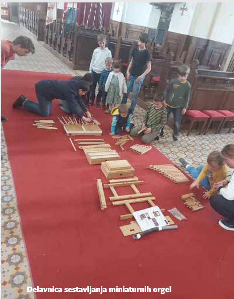
Delavnica sestavljanja miniaturnih orgel