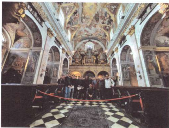
Udeleženci marčevskega dogodka na skupinskem posnetku v stolnici sv. Nikolaja.