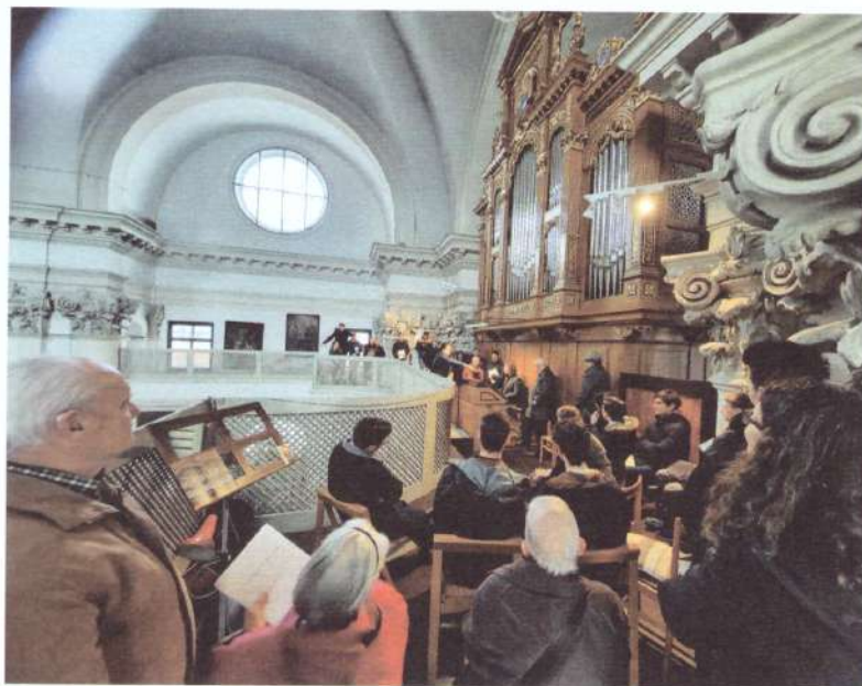
Udeleženci Popotovanja po sledih orgelske romantike v Ljubljani med ogledom Goršičevih orgel v cerkvi Sv. Trojice.